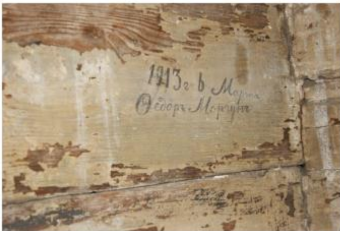
Старовинний напис на стіні дзвіниці Свято-Троїцького собору м. Новомосковська