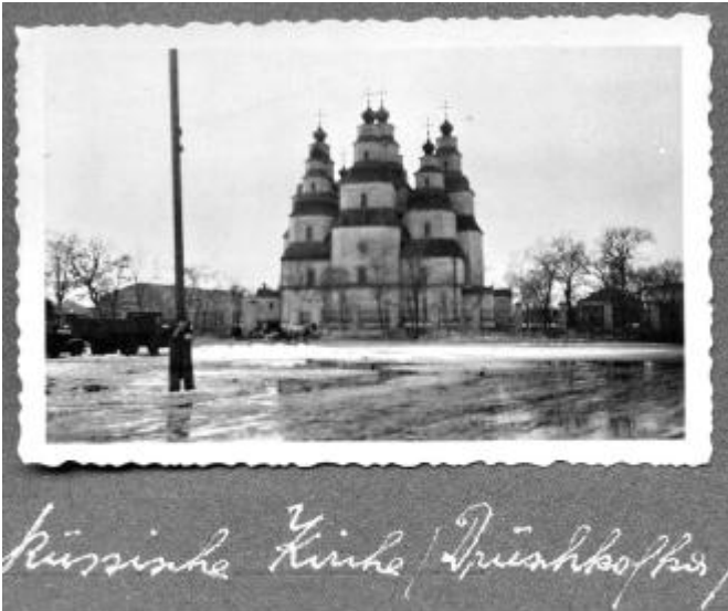
Німецька фотокартка. Троїцький собор, період нацистської окупації Новомосковська, 1941-1943 рр.