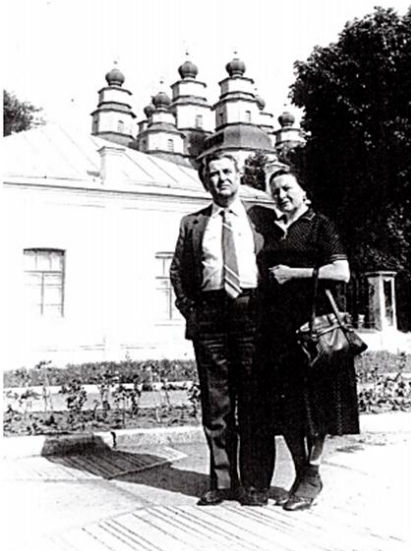
О. Гончар з дружиною поряд з Новомосковським собором, 1984 р.

5 грудня 1967 року Олесь Гончар запише у своєму щоденнику: «Зближується все, з плавень сарматських, з Новомосковських напливає собор. Ломівка стала Зачіплянка, все, змістившись в просторі, зблизилось, зажило вже у новій поетичній географії, в нових взаємозв'язках, і почуваєш, як із цих зближень, реальностей, із твоїх уявлень, фантазій і візій виростає щось єдине, народжується ота моцартівська гармонія мистецтва... Буде «Собор»!».