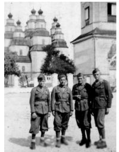
Італійські військові на соборній площі. Період нацистської оку- пації Новомосковська, 1941-1943 рр.

Сім поранень, сім бойових нагород. Не кожен дорослий може показати такий послужний список. Якою ж силою волі треба володіти, щоб винести таку долю. Життя його ще раз жорстоко випробувало через 15 років після закінчення війни. В один день трагічно загинули його дружина, син і дочка. Він витримав і це. Уся ця розповідь-урок мужності. Це не тільки данина минулому. Це заповідь майбутнього.