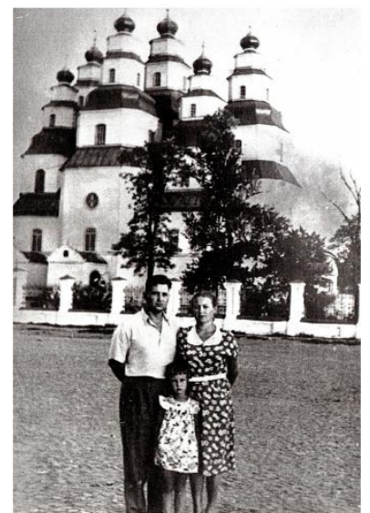
Письменник О. Гончар з дружиною на фоні Новомосковського собору, 1954 р.