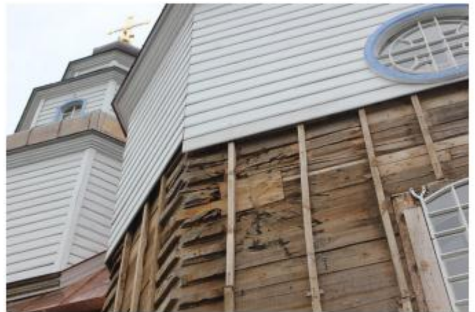
Слід від вибуху німецького танкового снаряду, що влучив у собор 27 вересня 1941 р. Відкритий під час реставраційних робіт у 2015 р.