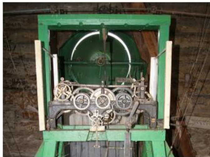
Механізм Соборного годинника, кін. XIX ст.