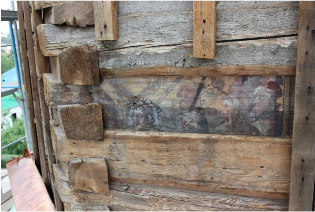
Фрагмент настінного розпису кін. XVIII - поч. XIX ст. Віднайдений під час реставраційних робіт у 2015 р.

Собор, наче старовинна книга, продовжує відкривати таємниці своєї більш ніж 240 – річної історії