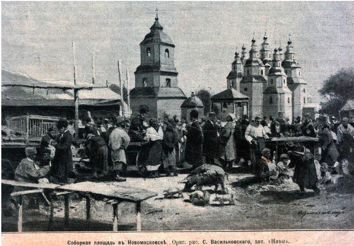
Соборная площадь въ Новомосковскѣ. Ориг. рис. С. Васильовскаго, авт. «Нивы».

Соборна площа у Новомосковську. Оригінальний малюнок С. Васильківського, створений у 80-х рр. XIX ст. Репродукція на сторінці журналу Нива, 1902 р.